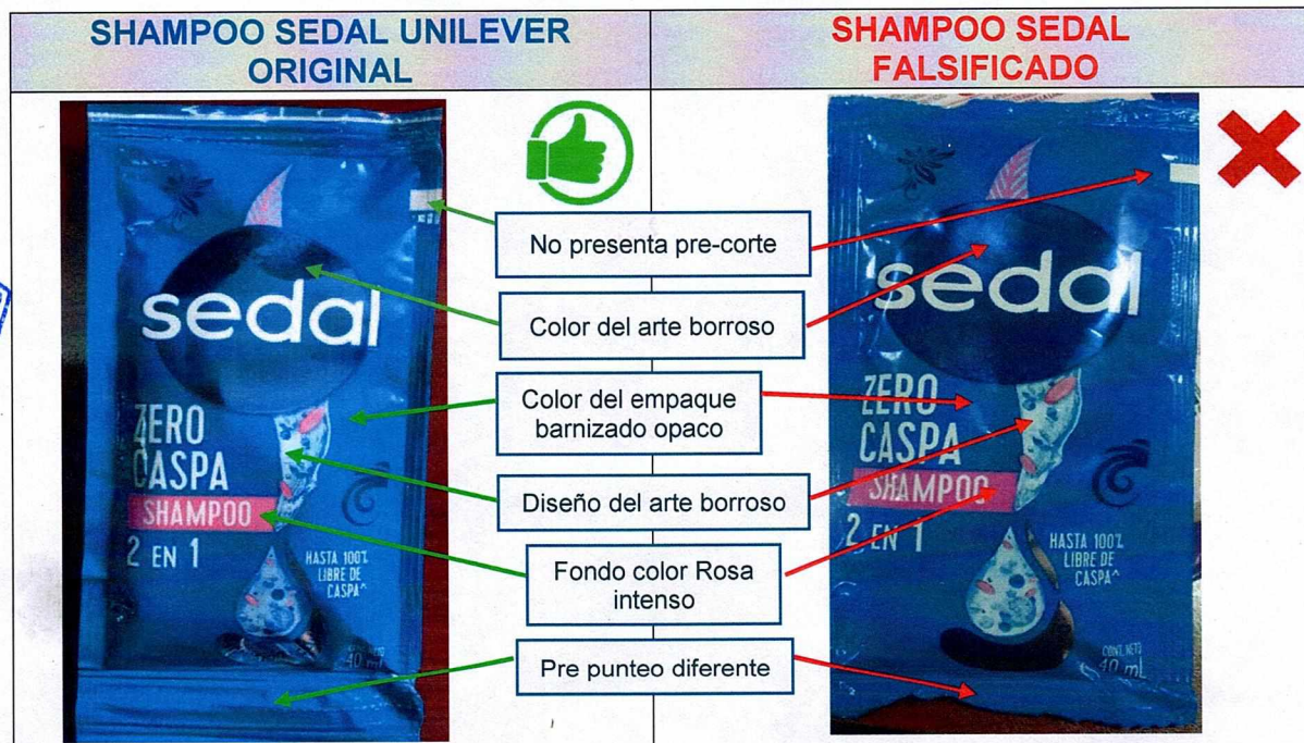
Tabla II. Cuadro comparativo del producto “SEDAL ZERO CASPA SHAMPOO 2 EN 1”